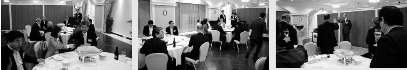
いわきワシントンホテル椿山荘